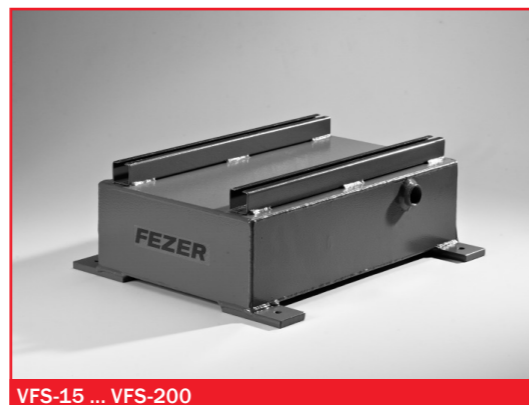
VFS-15 ... VFS-200