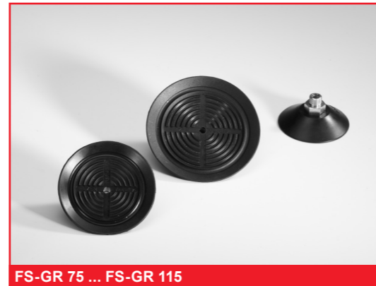
FS-GR 75 ... FS-GR 115