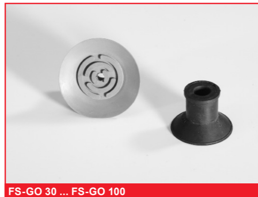
FS-GO 30 ... FS-GO 100