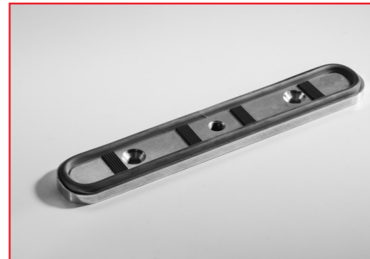
FSM 75x180 ... FSM 250x460