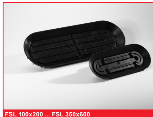
FSL 100x200 ... FSL 350x600