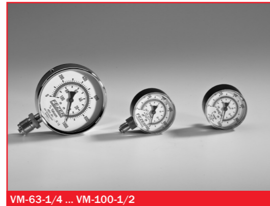
VM-63-1/4 ... VM-100-1/2