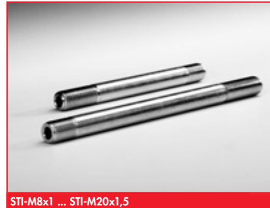
STI-M8x1 ... STI-M20x1,5