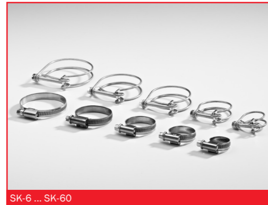
SK-6 ... SK-60