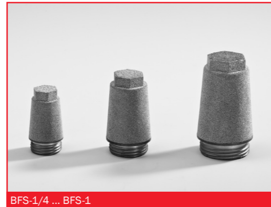
BFS-1/4 ... BFS-1